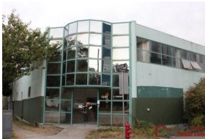
上图为温哥华警方于 2012 年 4 月份破获一起大型大麻种植案。 所在地点：温哥华的 Pender Ave 1201 号内